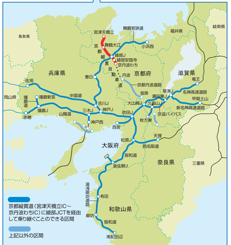
【ネクスコ西日本関西支社管内】