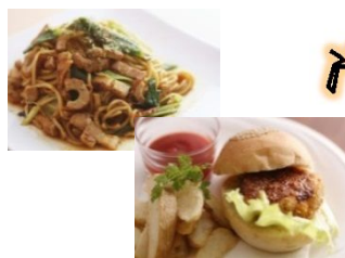
宮津カレー焼そば & 宮津バーガー (宮津市)