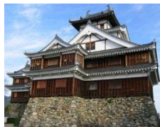
福知山城(福知山市)