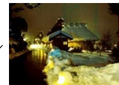
かやぶきの里(南丹市)