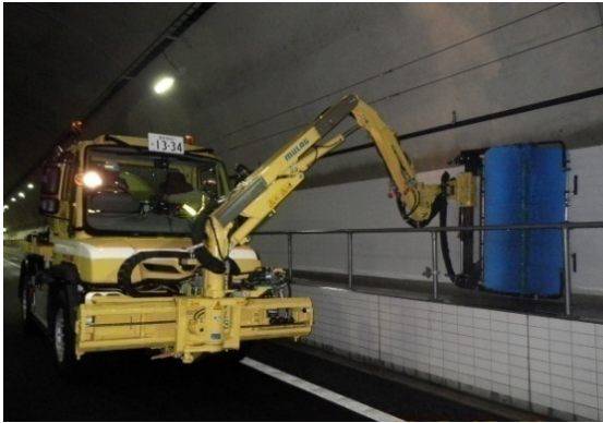
《トンネル側壁清掃》