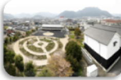
4 あやペグンゼスクエア